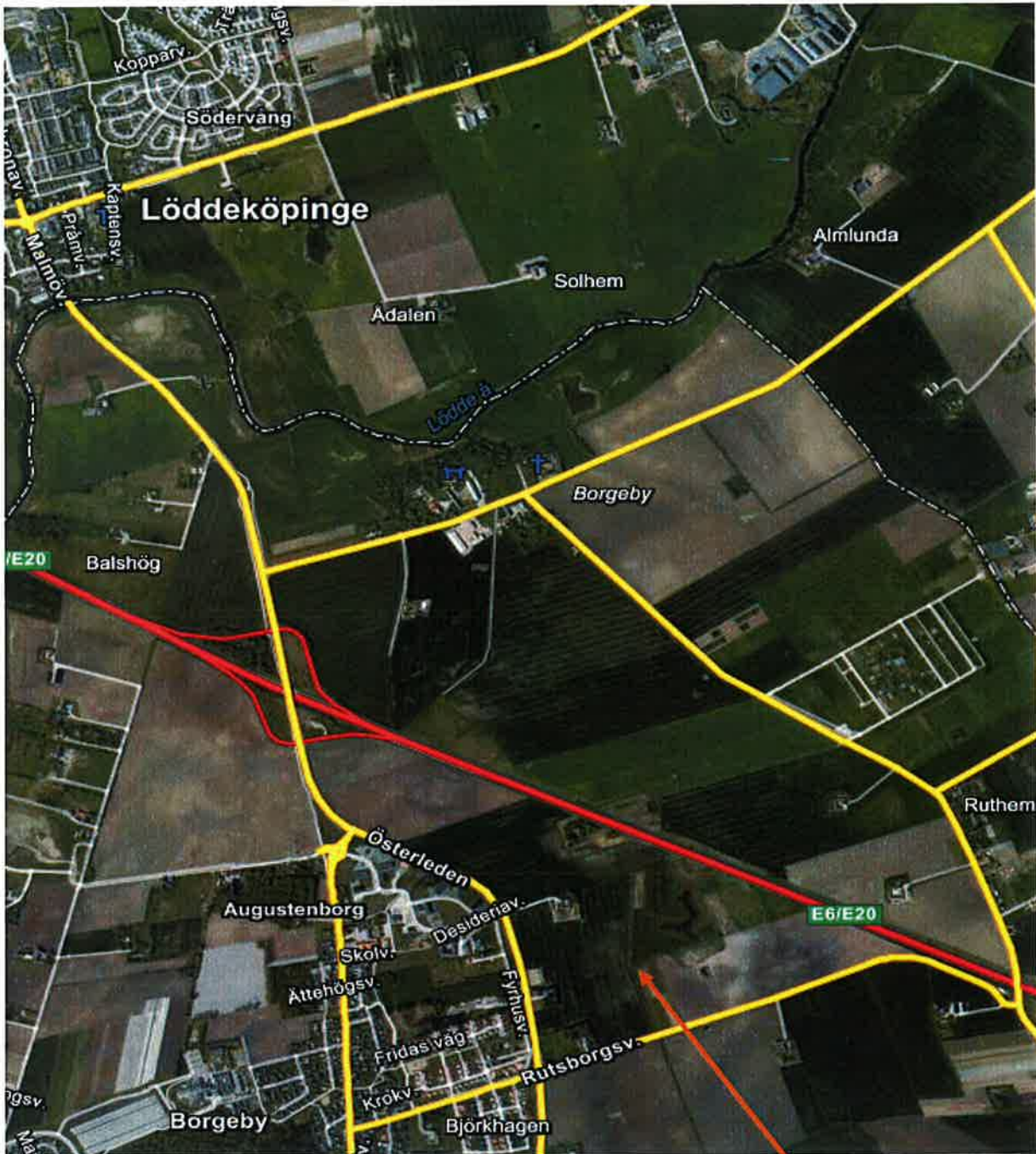
R3-9001, Bördighetsförsök, ADB: 03W067, Försöksnr: 4/10, Borgeby.