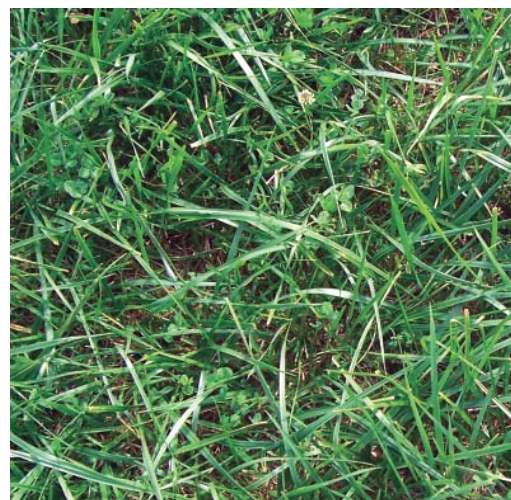
Vall III. Rådde skörd 3, 9 augusti. Led C, vitklöver, timotej och Hykor.